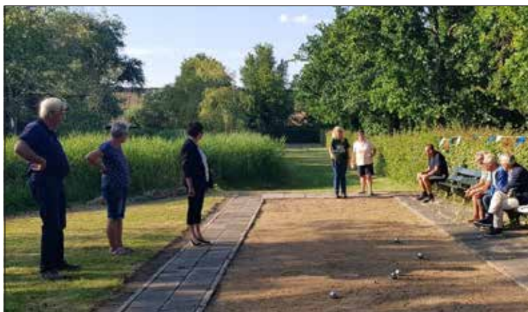
Gezelligheid ten top op de jeu-de-boule-baan. In de winter wordt er altijd op zondag vanaf 11.00 uur gespeeld. Iedereen is welkom. Speelballen zijn aanwezig. 1

Op de eerste avond waren ruim 30 mensen aanwezig. Uiteraard gaat het om het spel, maar zeker ook om het gezellig samenzijn. Veel mensen brengen jeu-de-boule-ballen mee, waarmee een ieder kan en mag spelen. Verder is er natuurlijk voor de gezelligheid een drankje op z'n plaats en nemende spelers zelf wat bier, wijn of fris mee en ook een hapje kaas of worst ontbreekt niet. Zo was het elke donderdagavond